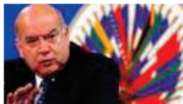
José Miguel Insulza Secretario General, Organización de los Estados Americanos (OEA) Inauguración del XIII Encuentro internacional Virtual Educa Panamá 2012

“Desde que ya en 2001 fuimos una de las instituciones promotoras de Virtual Educa, ésta es una de nuestras iniciativas más exitosas. Paralelamente, el Encuentro se ha convertido en referente para América Latina y el Caribe. Es una forma solidaria de entender cómo innovar y educar de forma cooperativa”.