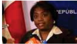
Lucy Molinar Ministra de Educación del Gobierno de Panamá VII Foro de Competitividad de las Américas Panamá 2013

“... Virtual Educa Panamá 2012 supuso un antes y un después en el futuro de mi país”.