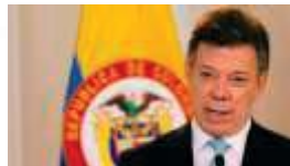
Juan Manuel Santos Presidente de Colombia Inauguración del XIV Encuentro internacional Virtual Educa Colombia 2013

“... Virtual Educa, tal vez el más importante encuentro de innovación educativa en América Latina y el Caribe, y un programa bandera de la OEA”.